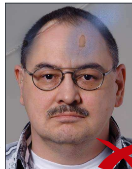
Knicke und Tintenflecke im Bild