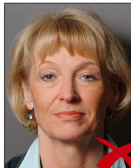
Schatten im Hintergrund

Auf dem Hintergrund dürfen keine Schatten entstehen. ◀