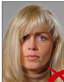
Haare im Gesicht