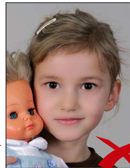
Gegenstand im Bild