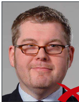
Brillenrahmen verdeckt Augen

Der Rand der Gläser oder das Gestell dürfen nicht die Augen verdecken. ◀