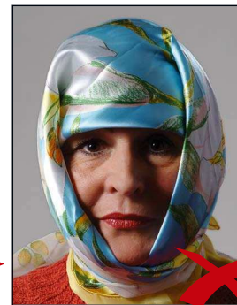
Schatten im Gesicht