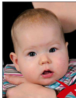
Zweite Person im Hintergrund