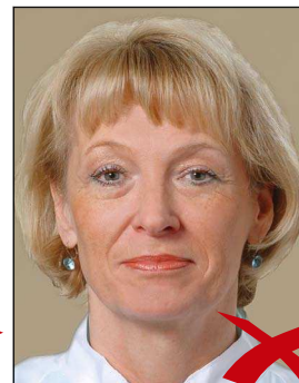
Hintergrund ohne Kontrast