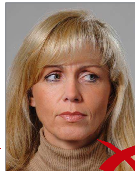
Blick zur Seite