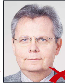
Kontrastarm durch Überbelichtung