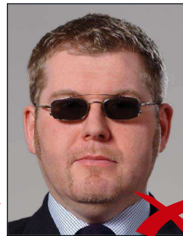
Brillengläser zu dunkel