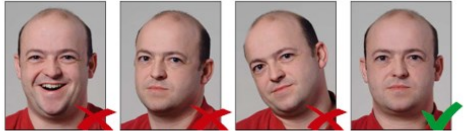
Miệng mở quá to

Người chụp cần có biểu cảm trung tính, miệng khép và nhìn thẳng vào máy ảnh. ◀