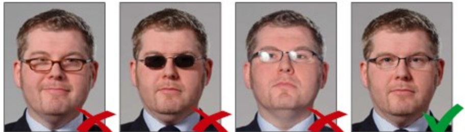
Gọng kính che mắt

Gọng kính không được phép che khuất mắt. ◀