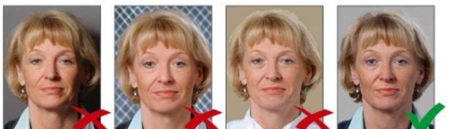
Đổ bóng phía sau