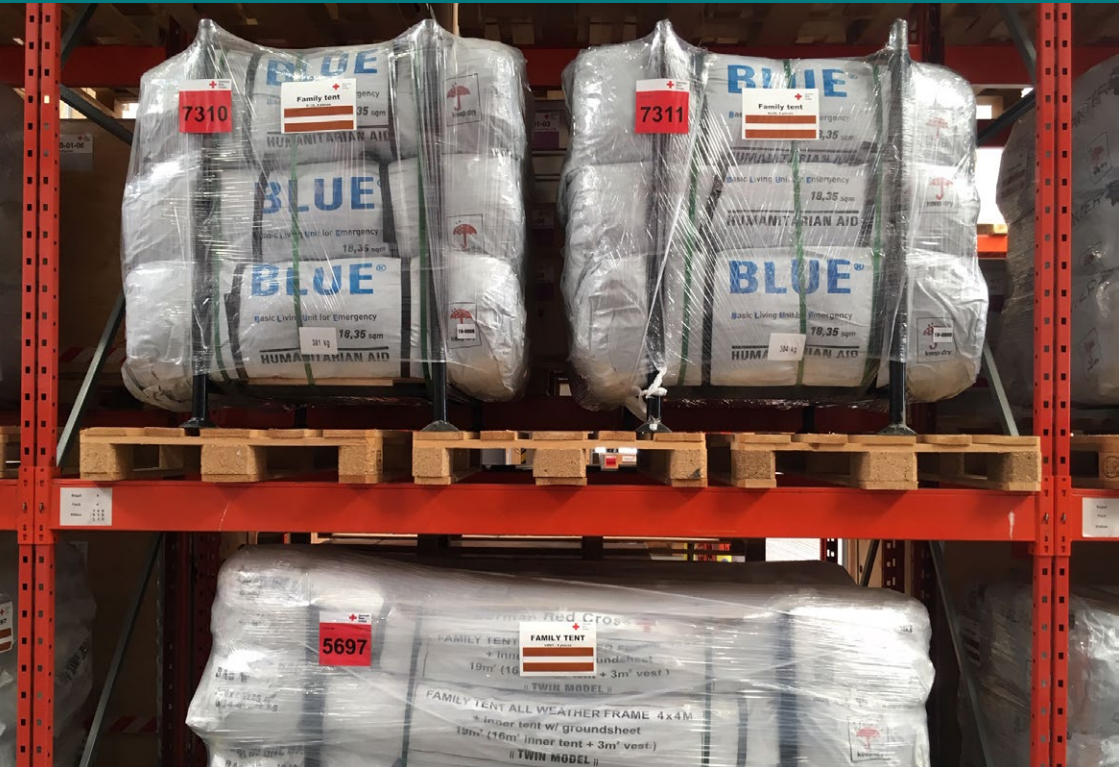
Zelte für Notfallunterkünfte im Lager eines Krankenhauses