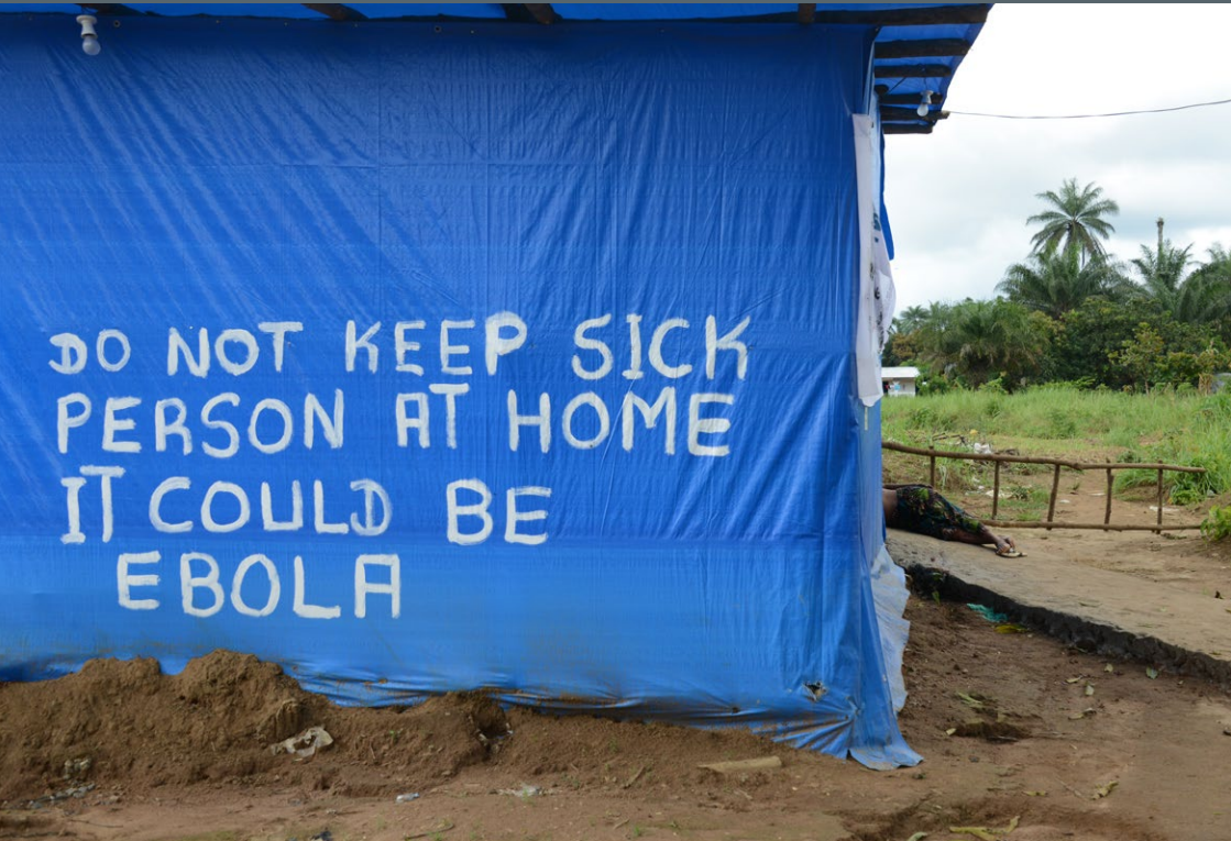
Warnung vor Ebola in Sierra Leone