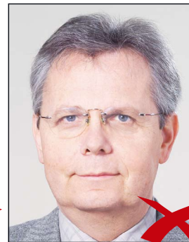
Kontrastarm durch Überbelichtung