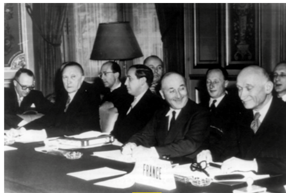
ROBERT SCHUMAN ET JEAN MONNET

Lorrain d'origine, bilingue et biculturel, Robert Schuman (1886-1963) sait que l'Allemagne et la France sont le cœur d'une Europe en paix. Avec pragmatisme, il cherche « un système dans lequel nous n'engagerions pas seulement nos paroles, mais nos intérêts ». Fait important, il sait le très européen chancelier fédéral Konrad Adenauer dans les mêmes dispositions. Il saisit un projet que lui soumet Jean Monnet (1888-1979), commissaire général au Plan, et en endosse la responsabilité.