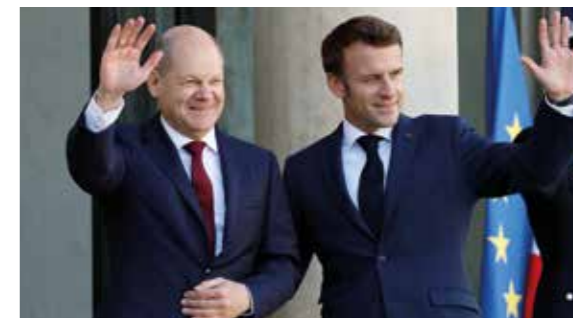
EMMANUEL MACRON & OLAF SCHOLZ (DEPUIS 2021)