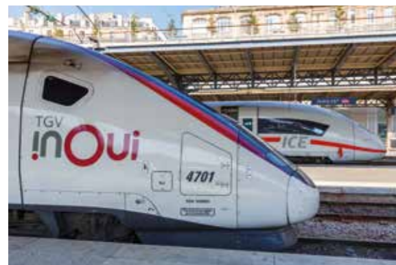
LE TRAIN RELIE LES EUROPÉENS

Communications, énergie, transports : l'axe franco-allemand est un nœud stratégique pour le développement de réseaux transeuropéens. Depuis la fin des années 2000, des trains à grande vitesse (TGV/ICE) relient Paris à Cologne, Francfort ou Munich. Fin 2023 s'ajoutera une liaison directe Paris-Berlin en environ sept heures. Parallèlement, les trains de nuit sont relancés entre Paris et Berlin et à travers toute l'Europe grâce au réseau Trans Europe Express. Dans la zone transfrontalière, des réunions d'experts sont prévues concernant les liaisons Colmar-Fribourg-en-Brisgau et Rastatt-Haguenau.