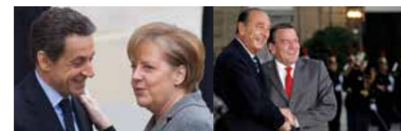
NICOLAS SARKOZY & ANGELA MERKEL (2007-2012)