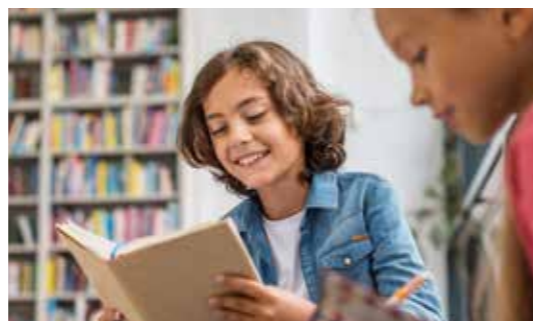
LA LANGUE, UNE CLÉ

Du traité d'Aix-la-Chapelle sont nées en avril 2021 deux plateformes numériques franco-allemandes pour les jeunes : la Collection européenne d'ARTE et de ses partenaires, et le projet ENTR (Deutsche Welle, France Médias Monde) sur des sujets d'actualité européenne.