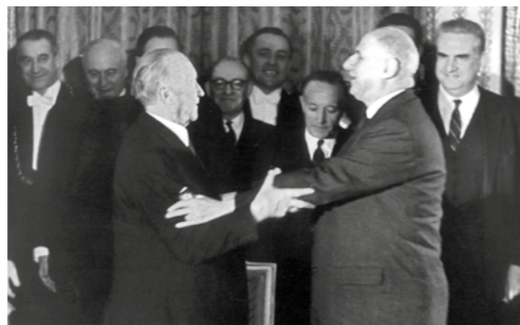
LA SIGNATURE DU TRAITÉ DE L'ÉLYSÉE

Au fil des années, le traité de l'Élysée va devenir la clef de voûte de la coopération franco-allemande. Il sera un catalyseur majeur du processus d'intégration européenne.