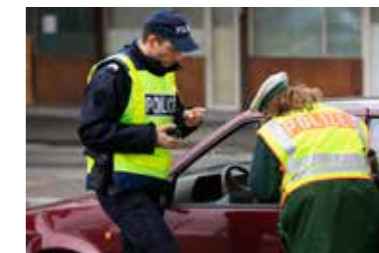
COOPÉRATION POUR LA SÉCURITÉ

Au printemps 2020, la pandémie a activé des réflexes de repli. Mais les frontaliers ont vite réagi pour rétablir les ponts entre les deux rives du Rhin. Témoins, le soulagement affiché lors du déconfinement et la création d'un centre de dépistage frontalier à Sarrebruck.