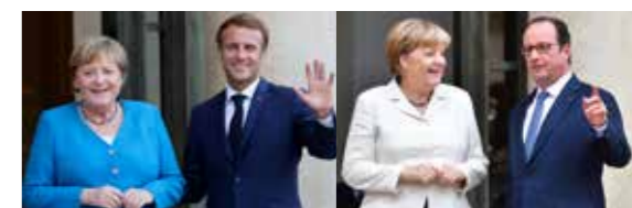
EMMANUEL MACRON & ANGELA MERKEL (2017-2021)