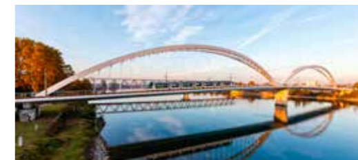
LE COMITÉ FRANCO-ALLEMAND DE COOPÉRATION TRANSFRONTALIÈRE (CCT)

Bilinguisme, mobilité, emploi, apprentissage, police, gestion sanitaire : les 450 kilomètres de la frontière franco-allemande ont vocation à devenir un concentré et un modèle d'Europe.