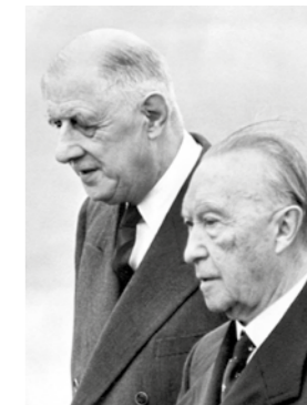
CHARLES DE GAULLE ET KONRAD ADENAUER