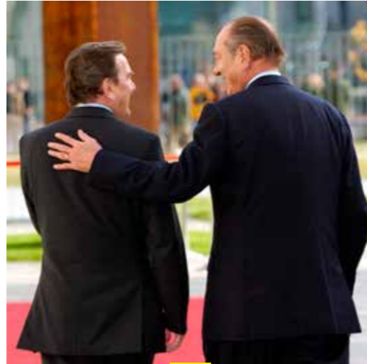
LE « RÉFLEXE » FRANCO-ALLEMAND

Mais un constat s'impose plus que jamais : sans locomotive franco-allemande, l'Europe n'avance pas.