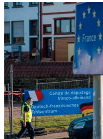
DES TERRITOIRES DANS LA PANDÉMIE

Au printemps 2020, la pandémie a activé des réflexes de repli. Mais les frontaliers ont vite réagi pour rétablir les ponts entre les deux rives du Rhin. Témoins, le soulagement affiché lors du déconfinement et la création d'un centre de dépistage frontalier à Sarrebruck.