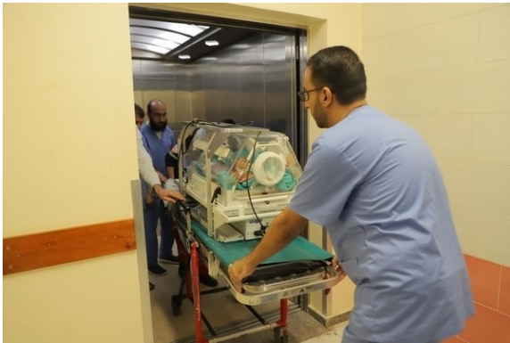
(صورة لحاضنة أطفال خدج تم توفيرها لمصر)

ندعم المساعي الدولية من خلال مساهمات فردية محددة وتعاونات ثنائية. نوفر لمصر 2 مليون يورو وللأردن 0.4 مليون يورو) الأجهزة الطبية والمواد الطبية المطلوبة مثلًا لرعاية المرضى من غزة. تحصل مصر أيضًا على حاضنات وأجهزة تنفس خاصة بالرضع ويتم نقلها عبر رحلات خاصة بالطائرات قامت بها القوات المسلحة الألمانية.