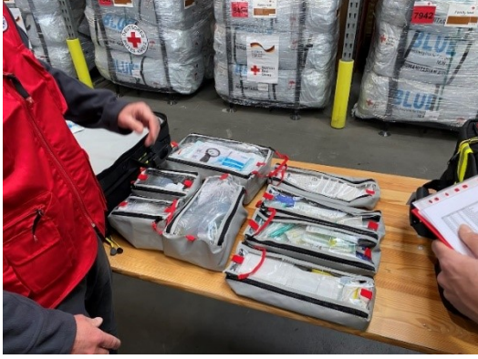
(حقيبة إسعافات أولية للمصابين)