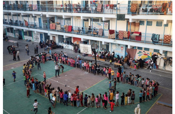
(نشاط بشأن الدعم النفسي الاجتماعي للأطفال في مركز إيواء رفح التابع لليونسف)