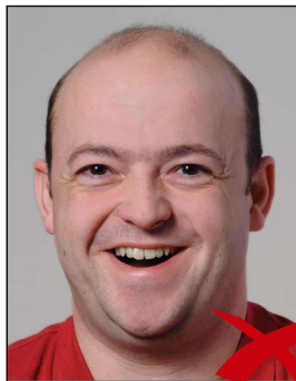
Mund zu weit offen

Die Person muss mit neutralem Gesichtsausdruck und geschlossenem Mund gerade in die Kamera blicken. ◀