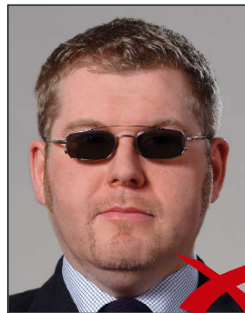
Brillengläser zu dunkel