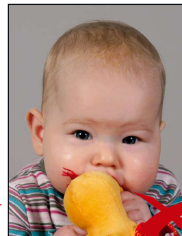
Gegenstand im Bild