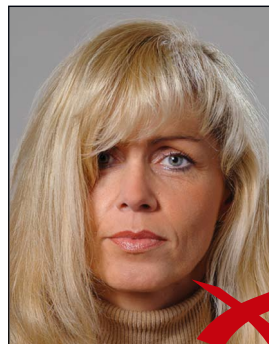
Haare im Gesicht