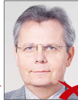
Kontrastarm durch Überbelichtung