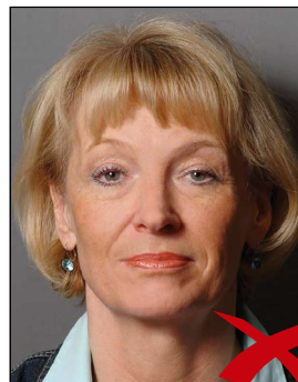
Schatten im Hintergrund

Auf dem Hintergrund dürfen keine Schatten entstehen. ◀