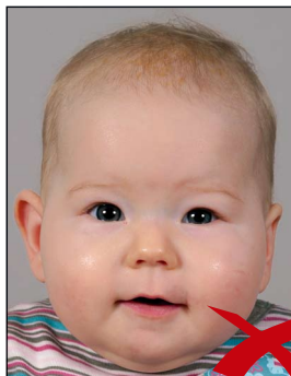
Kopf zu groß