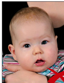
Zweite Person im Hintergrund