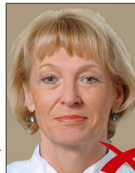
Hintergrund ohne Kontrast