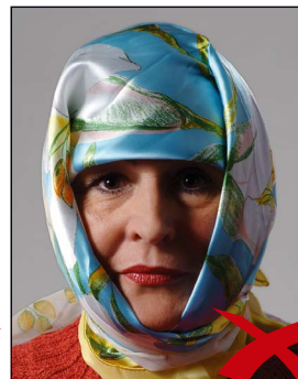
Schatten im Gesicht