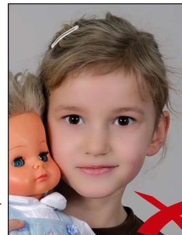
Gegenstand im Bild