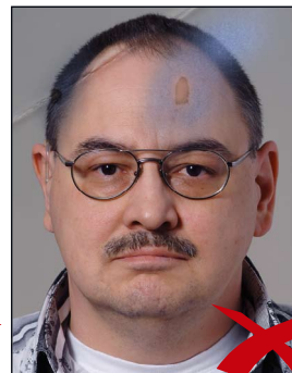
Knicke und Tintenflecke im Bild