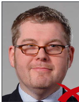
Brillenrahmen verdeckt Augen

Der Rand der Gläser oder das Gestell dürfen nicht die Augen verdecken. ◀