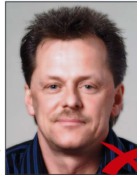
Reflexion im Gesicht