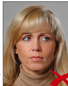
Blick zur Seite